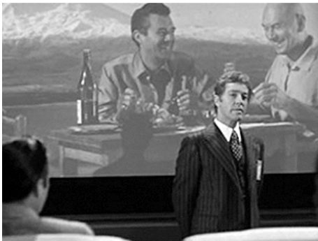
1972 LE SERPENT d'Henri Verneuil avec Dirk Bogarde, Yul Brynner