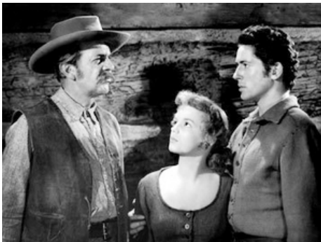
1949 ROSEANNA McCOY (Roseanna McCoy) d'Irving Reis avec Raymond Massey, Joan Evans