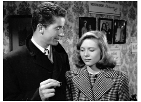
1948 LES AMANTS DE LA NUIT (They live by Night) de Nicholas Ray avec Cathy O'Donnell