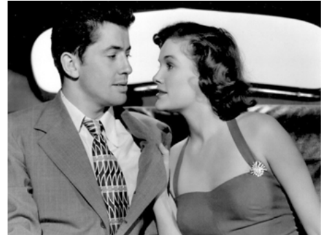
1948 LA RUE DE LA MORT (Side Street) d'Anthony Mann avec Jean Hagen