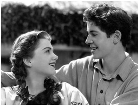
1943 L'ÉTOILE DU NORD (The North Star) de Lewis Milestone avec Anne Baxter