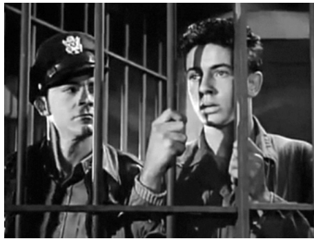
1944 PRISONNIERS DE SATAN (The Purple Heart) de Lewis Milestone avec Dana Andrews