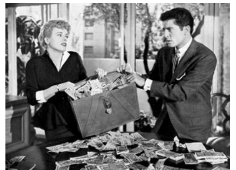
1950 SYMPHONIE EN 6-35 (Behave yourself!) de George Beck avec Shelley Winters