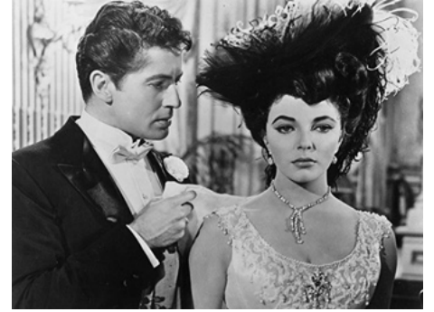
1955 LA FILLE SUR LA BALANÇOIRE (The Girl in the red velvet swing) de R. Fleischer avec Joan Collins