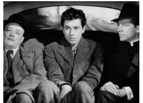
1950 LA MARCHÉ À L'ENFER (Edge of Doom) de Mark Robson avec Robert Keith, Dana Andrews