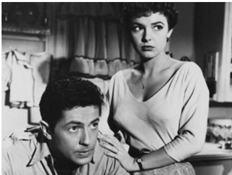
1955 LE ROI DU RACKET (The naked Street) de Maxwell Shane avec Anne Bancroft