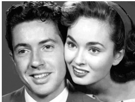
1950 CELLE DE NULLE PART (Our very Own) de David Miller avec Ann Blyth