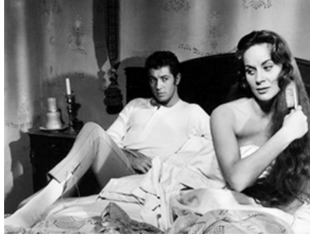
1954 SENSO (Senso) de Luchino Visconti avec Alida Valli