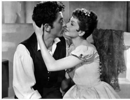
1952 HANS CHRISTIAN ANDERSEN ET LA DANSEUSE (Hans Christian Andersen) de Ch. Vidor avec Zizi Jeanmaire