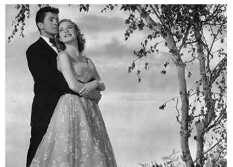
1951 FACE À L'ORAGE (I want you) de Mark Robson avec Peggy Dow