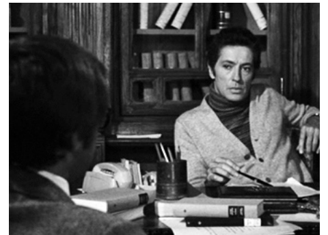
1971 À LA RECHERCHE DU PLAISIR (Alla ricerca del piacere) de Silvio Amadio