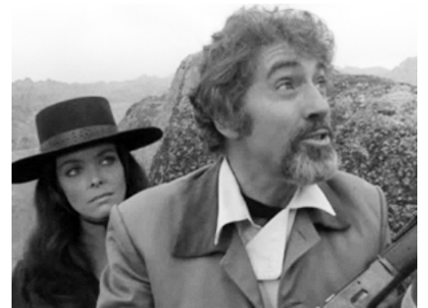
1973 LES COLTS AU SOLEIL (Io chiamavano mezzogiorno) de Peter Collinson avec Patty Shephard