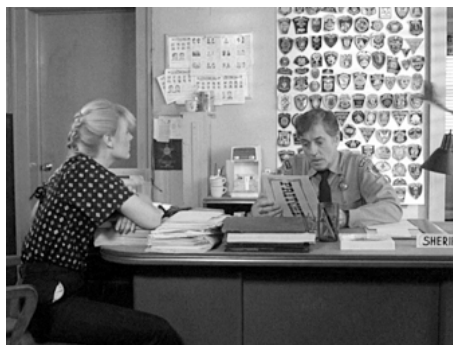
1981 ROSEMARY'S KILLER (The Prowler) de Joseph Zito avec Vicky Dawson