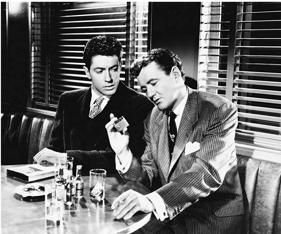
1951 L'INCONNU DU NORD-EXPRESS (Strangers in a Train) d'Alfred Hitchcock avec Robert Walker