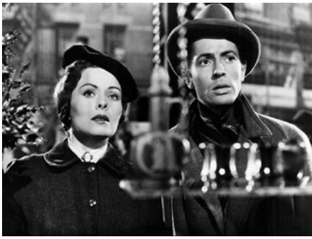
1952 LA SARABANDE DES PANTINS (O. Henry's Full House) d'Henry Hathaway avec Jeanne Crain