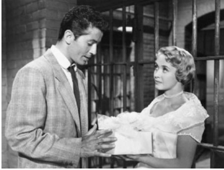
1953 LE JOYEUX PRISONNIER (Small Town Girl) de Leslie Kardos avec Jane Powell