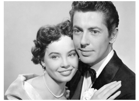
1953 HISTOIRE DE TROIS AMOURS (The Story of three loves) de Vincente Minnelli avec Leslie Caron