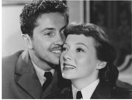
1948 VOUS QUI AVEZ VINGT ANS (Enchantment) d'Irving Reis avec Evelyn Keyes