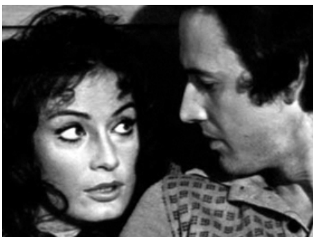
1974 INFAMIE (La moglie giovane) de Giovanni d'Eramo avec Marisa Mell